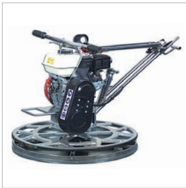
MOSKITO SG Benzin